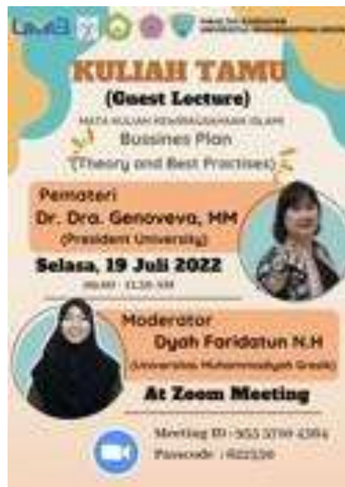
Gambar 1. E-brosur Kuliah Tamu

Kuliah tamu akan diadakan secara daring, melalui aplikasi Zoom. Berdasarkan hasil rapat tersebut, kemudian dibuat e-brosur seperti pada Gambar 1 di bawah.