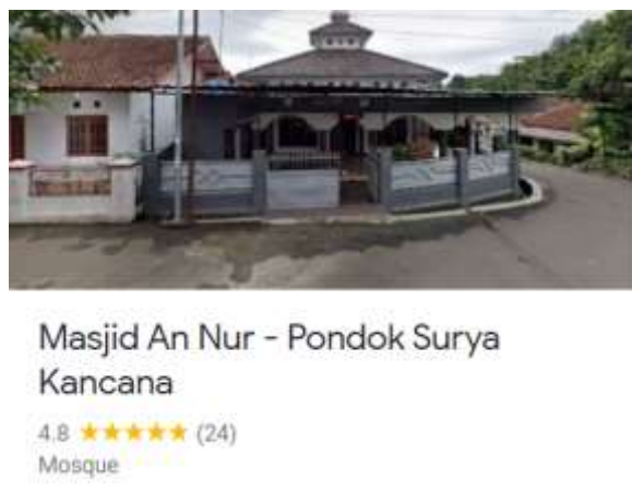
Gambar 9. Jumlah Review Jamaah Baru di Google Maps

Website Masjid An Nur selesai dikembangkan pada tanggal 9 Mei 2023 dengan tampilan akhir seperti pada Gambar 8 dan dapat diakses melalui tautan website : https://sites.google.com/view/masjid-an-nur-btn/beranda melalui peramban di Desktop maupun Handphone . Jumlah pengunjung website pada hari diluncurkannya website Masjid An Nur sebesar 133 pengunjung dan pada tanggal 10 Mei 2023 sebesar 215 pengunjung. Terjadi peningkatan pengunjung sebesar 82 pengunjung. Jumlah kedatangan jamaah luar dilihat dari review lokasi yang terdapat pada Google Maps yang disematkan pada website . Berdasarkan Gambar 9 setelah website diluncurkan jumlah jamaah baru yang memberikan review di Google Maps sebanyak 24 orang dengan rating bintang 5.