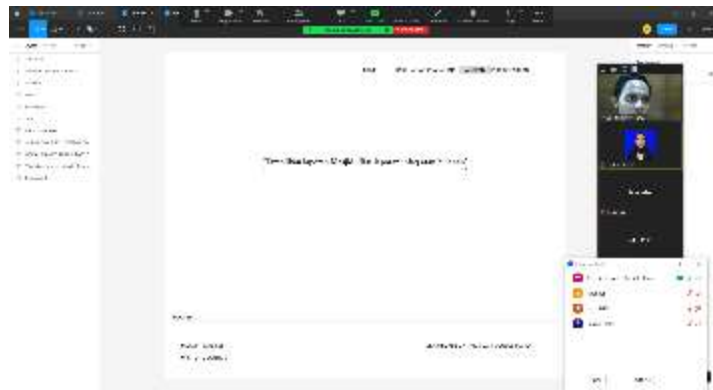
Gambar 4. Diskusi Konsep Antarmuka Website

Dari hasil diskusi diperoleh kesepakatan bahwa website Masjid An Nur akan menampilkan empat halaman utama. Namun tidak menutup kemungkinan di kemudian hari akan bertambah halaman sesuai dengan kebutuhan DKM Masjid An Nur. Keempat halaman tersebut, antara lain halaman beranda, sarana dan prasarana, laporan keuangan Masjid An Nur, perpustakaan online , dan terdapat satu sub-menu kegiatan. Pada halaman kegiatan rencananya akan digunakan sebagai media informasi terkait produk-produk yang dihasilkan oleh warga Pondok Surya Kancana yang dapat dijual ketika ada kegiatan keagamaan di Masjid An Nur. Hal ini diharapkan dapat meningkatkan perekonomian warga Pondok Surya Kancana.