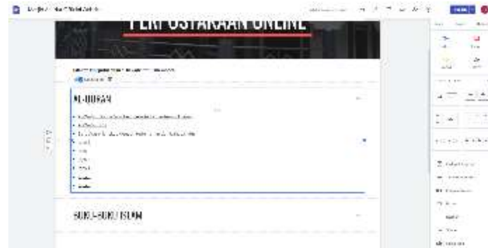
Gambar 7. Penambahan Halaman Perpustakaan Online