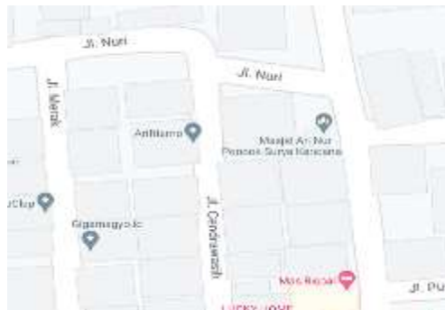
Gambar 1. Denah Lokasi Masjid An Nur Pondok Surya Kencana

Pelaksanaan pengabdian dilakukan di wilayah Perumahan Pondok Surya Kencana RW 10, Kelurahan Bubulak, Kecamatan Bogor Barat, Kota Bogor, Provinsi Jawa Barat pada tanggal 8 sampai 9 Mei 2023. Gambar 1 berikut ini merupakan gambar denah lokasi Masjid An-Nur yang terletak di tengah-tengah pemukiman warga.