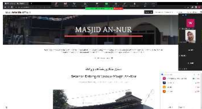
Gambar 8. Hasil Akhir Website