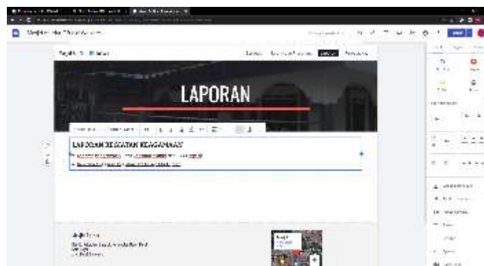
Gambar 6. Pengembangan Halaman Laporan Keuangan Masjid An Nur