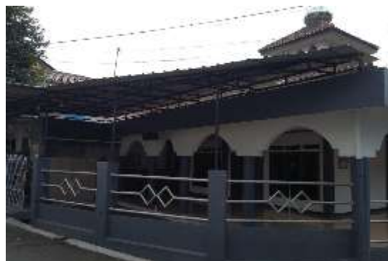
Gambar 2. Teras Masjid An Nur Pondok Surya Kencana

Pada Gambar 2 terlihat foto masjid yang memiliki pelataran luas sehingga sangat cukup untuk menampung kurang lebih sebanyak 200 orang jamaah. Selain itu, masjid An Nur juga menyediakan